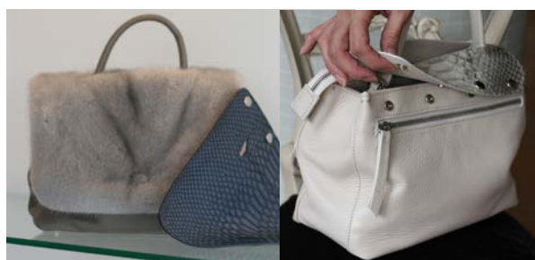
パイソンフラップ Mini ¥25,000(税別) パイソンフラップ Large ¥35,000(税別) ミンクフラップ Mini ¥45,000(税別)

画像にはございませんが店頭でも人気の取り外し可能なストラップも受注可能です。 幅広ストラップ ¥29,000(税別)