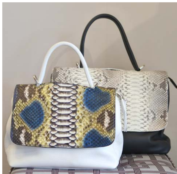
右: Changeable Bag Large ¥120,000(税別) 幅 35cm 高さ 25cm 奥行き 11cm 左: Changeable Bag Mini ¥90,000(税別) 幅 24.5cm 高さ 19cm 奥行き 11cm

画期的なChangeable(取り替え可能) システムで、別売りのフラップのみをご注文いただきますと、お召し物や季節に合わせて異なるバッグかのように多様にお使いいただくことが可能です。本体カラーもフラップカラーも多数ございますので、ぜひ店頭やオンラインショップにてバリエーションをご覧くださいませ。